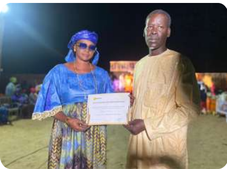
Remise des attestations de participation + foire des entrepreneurs locaux et des GIE de femmes

Cette huitième édition du Festival a rassemblé toute la communauté de Gandiol pour repousser les limites de la créativité , célébrant la diversité , l' innovation et l' esprit communautaire qui font du festival un rendez-vous exceptionnel qui "rassemble et unit les forces locales" .