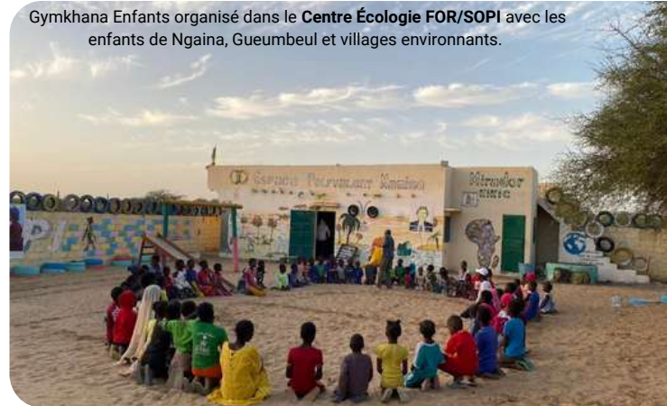
Gymkhana Enfants organisé dans le Centre Écologie FOR/SOPI avec les enfants de Ngaina, Gueumbeul et villages environnants.

Initié depuis 2016 par l'association Hahatay , le Festival Taaru Gandiol , c'est plus d'une semaine d'activités (22-31/12/2023) visant à valoriser nos réalisations et celles des hommes et des femmes évoluant dans différents domaines : culture, commerce, transformation, couture , etc. Cette année, avec nos collaborateurs, partenaires et la population locale, nous avons valoriser l' esprit créatif des acteurs du territoire à travers différentes activités et animations .